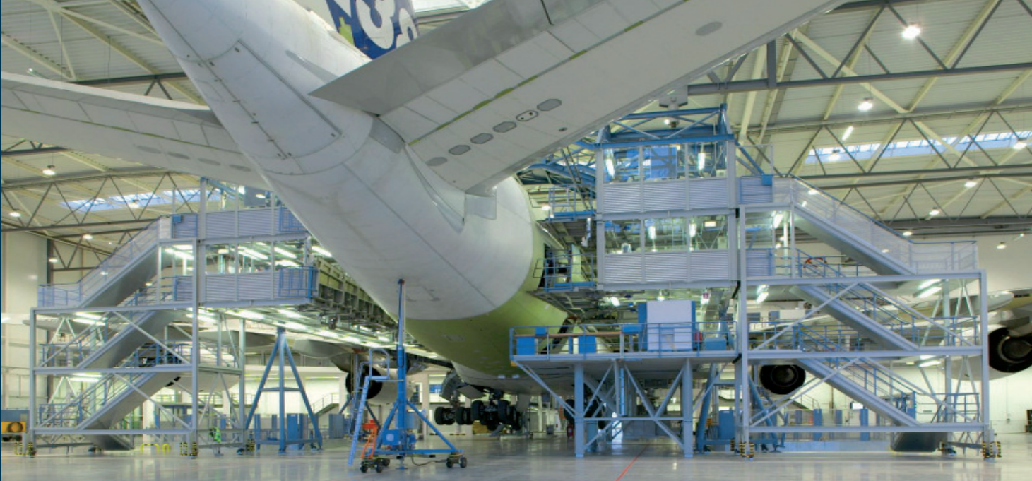
Ausstattung Airbus A380